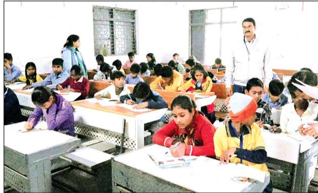
विदिशा। शहर में बनाए गए परीक्षा केंद्रों पर पहला पर्चा हल करते हुए विद्यार्थी।

पेपर देने नहीं पहुंचे। वहीं कक्षा आठवीं में भी बासोदा ब्लॉक में सबसे अधिक 391 परीक्षार्थी पेपर देने नहीं पहुंचे। इसके बाद कुरवाई में 345 और नटेरन में 334 छात्र परीक्षा देने नहीं पहुंचे। वहीं परीक्षा में किसी तरह की गड़बड़ी को रोकने के लिए जांच दल की टीमों सिरोंज, कुरवाई, नटेरन, ग्यारसपुर व विदिशा ब्लॉक में निरीक्षण करने पहुंची। दोनों परीक्षाओं में जिलेभर में कहीं भी नकल प्रकरण नहीं बना। वहीं जिले में गुरुवार को आयोजित कक्षा 10वीं एवं 12वीं की बोर्ड परीक्षाएं शांतिपूर्ण सम्पन्न हुईं। जिला शिक्षा