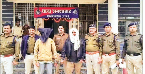
शमशाबाद। दोनों आरोपियों को गिरफ्तार कर थाने लेकर आई पुलिस।

घटना ग्राम छापरी की है। गुरुवार को वन विभाग की टीम सर्च वार्ड के दौरान कीमती सागौन से भरी ट्रॉली जब्त कर ला रही थी, तभी आरोपियों ने हमला कर दिया। हमले